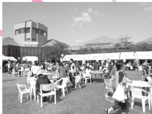
昨年のふれあいまつりの様子