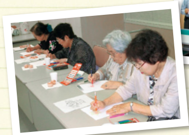
江並上いきいきサロン