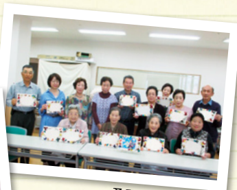
桑野いきいきサロン