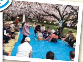
西古松若松サロン