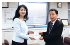
(公財)岡山市ふれあい公社 ※敬称略