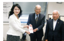
木下利玄生家保存会 木下利玄生家愛護委員会

ご協力いただいた募金は、中央共同募金会を通じて被災者の方々の支援に使わせていただきます。