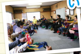
西古松ひまわりサロン