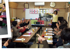
野田中ふれあいサロン