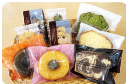
クッキー、パウンドケーキ、焼きドーナツ

◀スパンコールやビーズ製品、刺し子布巾など、季節に合った 絵柄やデザインを工夫しながら取り組んでいます。