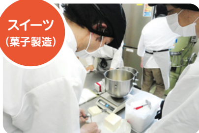
毎日手作りで製造をしています!

▲チームワークを大切に、愛情と笑顔をとっぴり注いだおいしいスイーツを皆様 のところへお届けします。