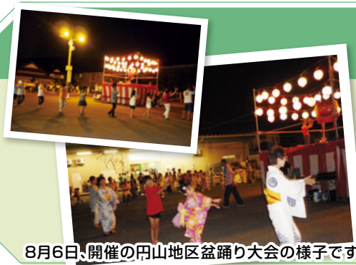
8月6日、開催の岡山地区盆踊り大会の様子です。