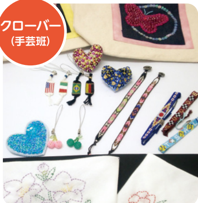
刺子布巾、スパンコール、ストラップ、プレスレット