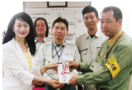
国土交通省岡山国道事務所管内 岡山地区安全衛生協議会 ※敬称略