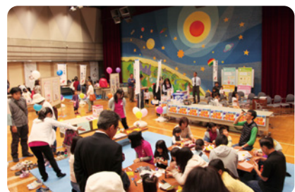
※写真は昨年度の様子です。