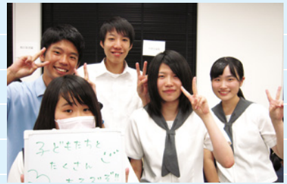
※事前研修会の様子