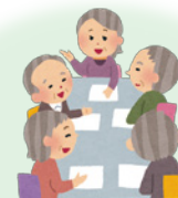
話し合いの場づくり