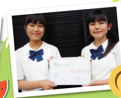
▲昨年度の夏のボランティア参加者の様子(事前説明会にて)