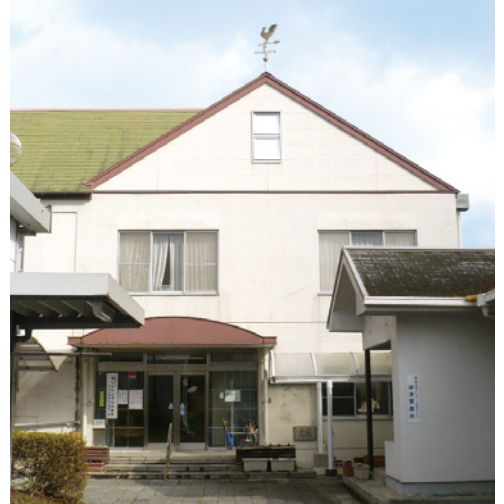
岡山市御津老人福祉センター 岡山市社会福祉協議会御津分室・御津支部事務局

御津地域は、岡山市の北部に位置し、旭川と国道53号線、津山線が南北に縦断し、面積の76%を山林が占めている山間部に位置します。高齢化率も年々高くなり、御津支部では、だれもが住み慣れた場所で、安心して心豊かに暮らせる地域を目指して、それぞれの地域のニーズに即した支援、地域福祉活動を推進しています。