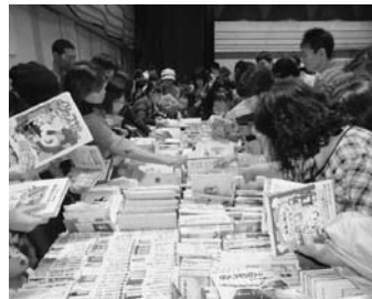
古本チャリティバザール