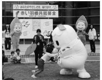
ちびっ子大相撲大会