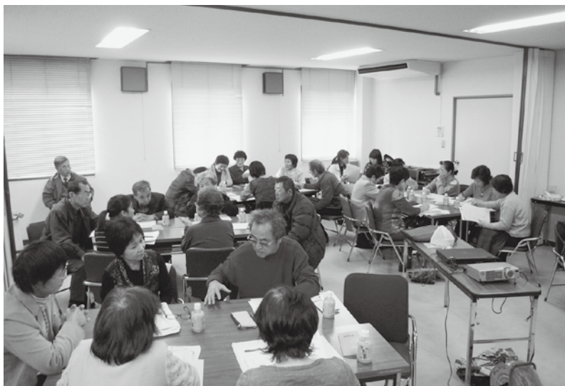
第4回 参加者同士で意見交換会