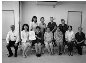
ボランティアサークルほほえみ様

本会の活動にご支援を賜っている法人会員の皆様方です。いつも大変ありがとうございます。 (平成22年11月入金分まで掲載)