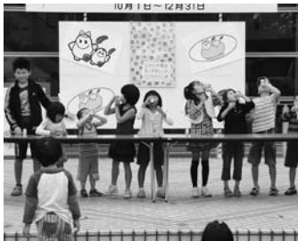
ヤクルト早飲み大会

当日は、古本チャリティバザールの他にも、恐竜展やちびっ子大相撲大会、野菜朝市などの催しもあり、ちびっ子大相撲大会では、超巨大な愛ちゃんがちびっ子達に10戦全敗という大波乱も起き、これには愛ちゃんもひどく落ち込んでいました。とにもかくにも、約9,000人もの方が来場され大盛況でした。