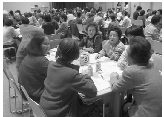
グループ別情報交換 みなさん熱心に話しこんでいました。

参加者からは「活動発表が聞けてよかった」「交流会で他の地区の話が参考になった」などの感想があり、皆さん熱心に話し合いに耳を傾けていました。