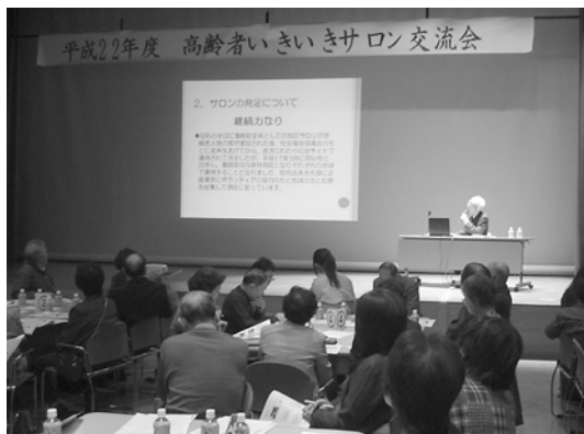
市内2カ所のサロンの活動発表を行いました。

いきいきサロンを実施されている方、立ち上げを予定されている方を対象に、平成23年2月25日に岡山ふれあいセンター（中区桑野）にてサロン交流会が開催され、約210名の参加がありました。