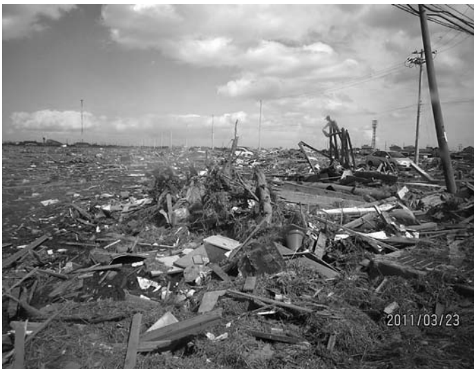
仙台市の津波の被害の様子

3月11日に東北地方太平洋沖で発生した地震により、 甚大な被害が発生しました。 岡山市社会福祉協議会では、職員を現地に派遣すると共に、 ボランティア支援活動を行いました。