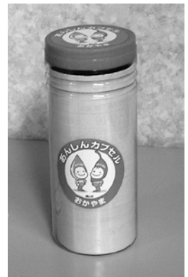
あんしんカプセルおかやま

この活動は地域の安全安心ネットワークが行う「地域保健福祉のモデル事業」の活動の取り組みの1つです。平成22年度は市内16地区がモデル地区として選定されました。社会福祉協議会は、岡山市から委託を受け、地域包括支援センターと連携しながら支援にあたっています。