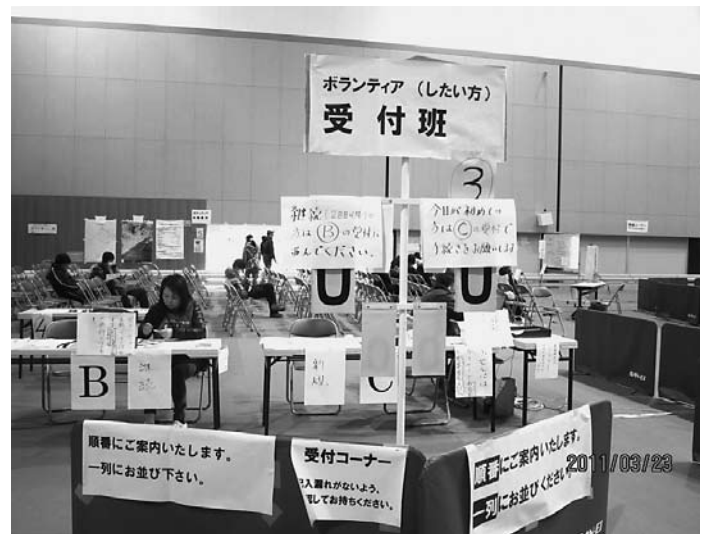
仙台市ボランティアセンターの様子