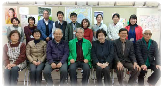
「旭竜学区支え合い推進協議会のみなさん」