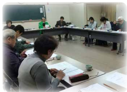
支え合い推進会議