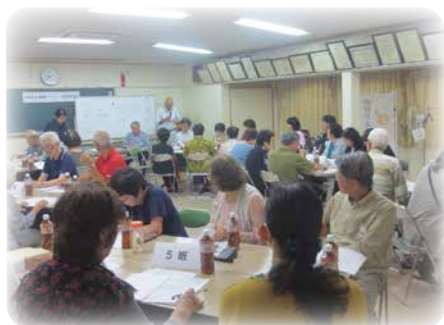
アンケート結果報告会

現在は、アンケートで要望のあったゴミ出しや話し相手等の生活支援サービスの創出に向けて、メンバーで定期的に集まり話し合っています。