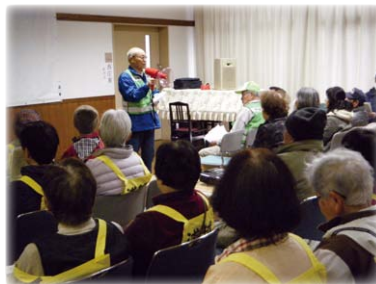
(避難の在り方について説明)