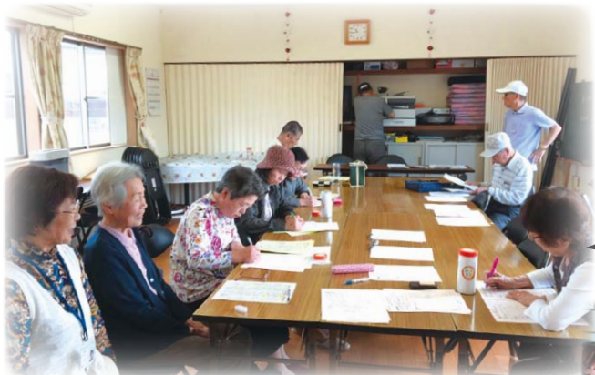
あんしんカプセル更新の様子

また、平成31年度より「南輝学区第2次地域福祉活動計画」を策定し、高齢者支援をはじめ、防災や広報啓発活動、次世代の育成について、南輝ケア会議で活発に取り組んでいます。