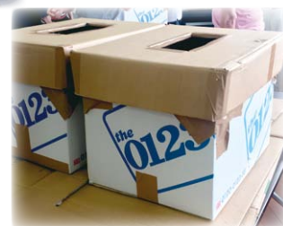
南輝ケア会議全体会