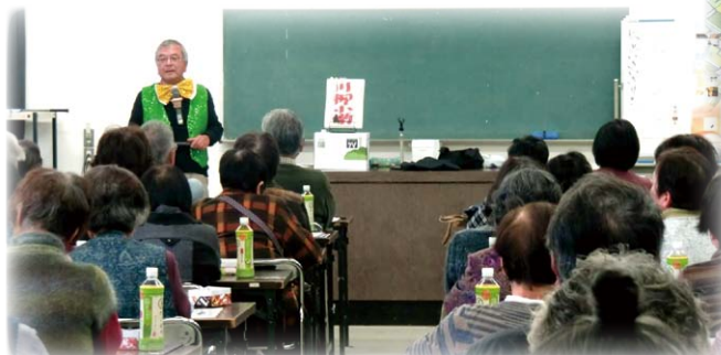
いきいき活動交流会

シルバー見守り隊員と対象者の方が一緒に公民館に集まってあんしんカプセルの更新を行う町内もあり、みんなで和気あいあいとカードを書くことが見守りにもつながります。