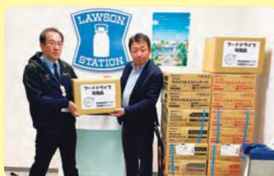
株式会社ローソン 中四国カンパニー様