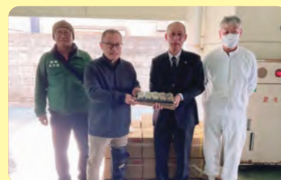
島乃香株式会社様