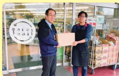
株式会社イトミー eco eat 岡山北店様