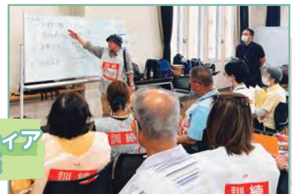
災害ボランティア 養成講座